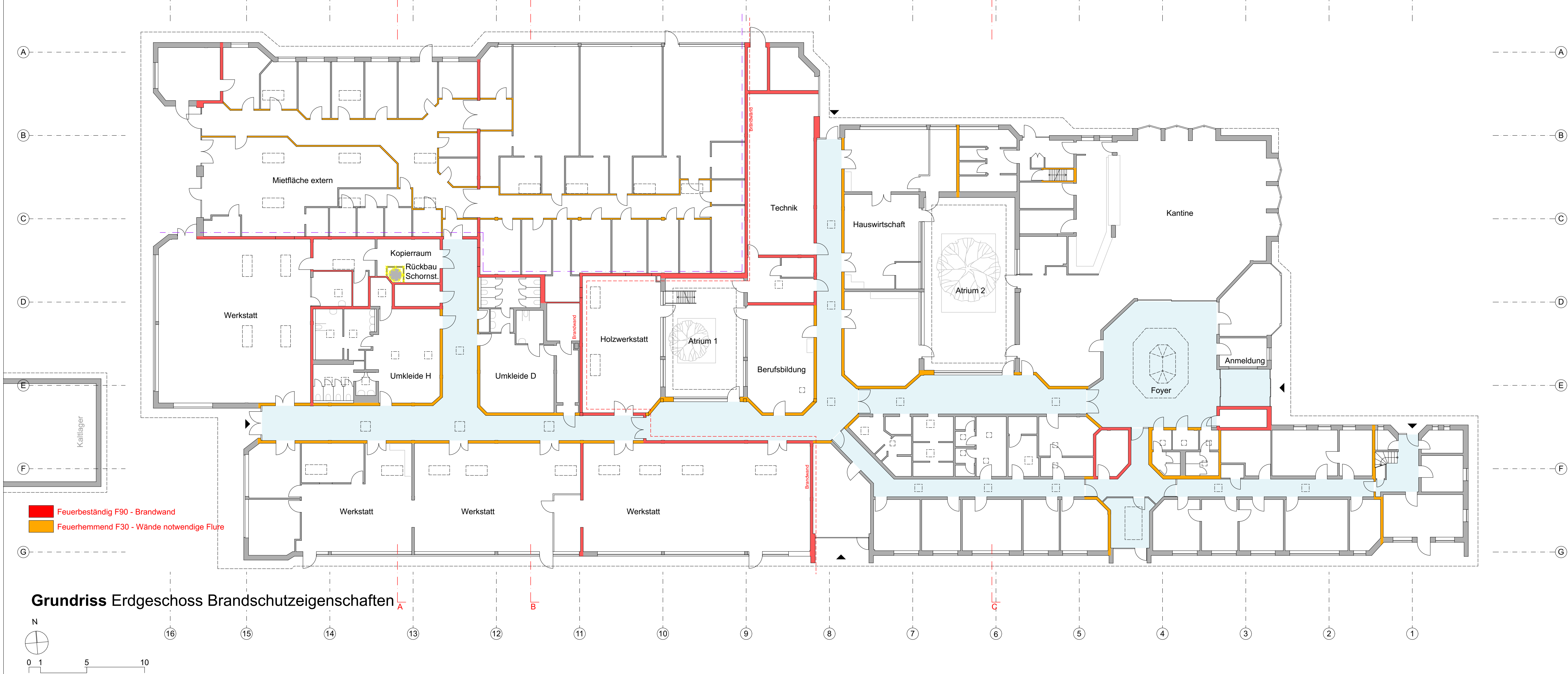
Grundriss Erdgeschoss Brandschutzeigenschaften